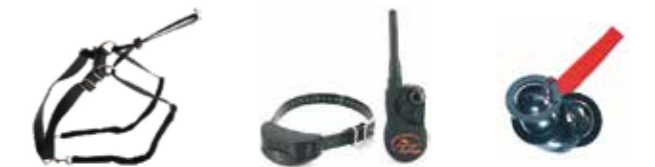
Erziehungsgeschirre, Elektro- und Sprühhalsbänder, Diskscheiben