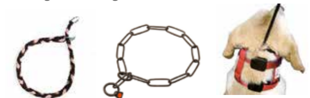
Würgehalsbänder (je dünner, umso schmerzhafter), meist werden sie extrem hoch am Kopf angesetzt