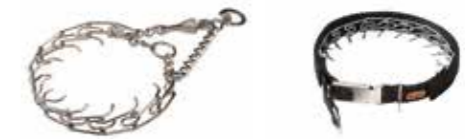
Stachelhalsband (wird auch Dressurhalsband bzw. Erziehungshalsband genannt)